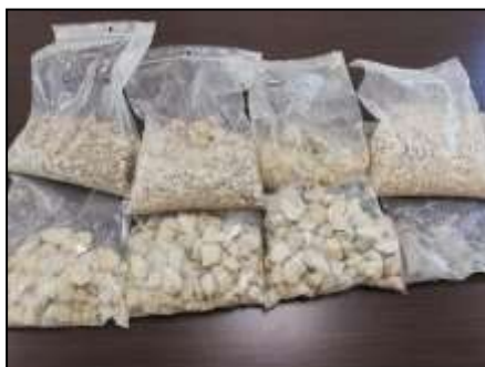
Les échantillons de gravats

Tout d'abord, il s'agit de dénicher ladite source. Le terrain est dégagé de ses tas de ronces pour permettre la visibilité. Puis on creuse à 1 mètre de profondeur et on trace un sillon d'environ 7 m qui remonte la pente. Témoins de ces interventions, les gravats extraits et le tas de terre déposé sur le côté.